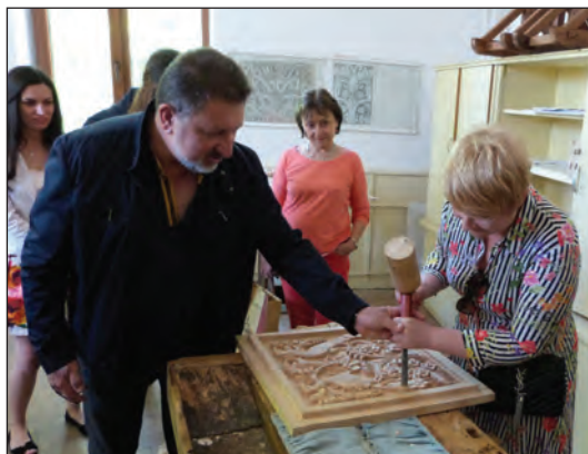
Ден на отворените врати. Делегатите от Полша не само се насладиха на пластиките от дърво, а дори направиха опит сами да дърворезбоват