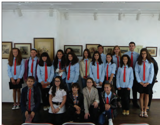
Литературно четене на собствени творби на ученици от СУ „П. Р. Славейков,,