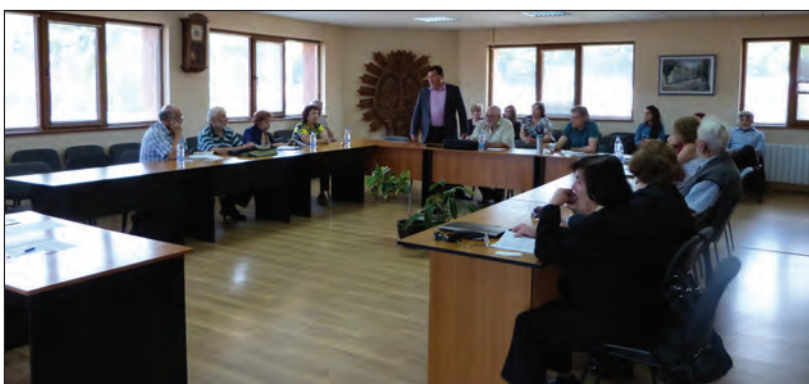
Теоретична конференция „Поезия и политика: 190 години от рождението на поета и държавника Петко Славейков,,