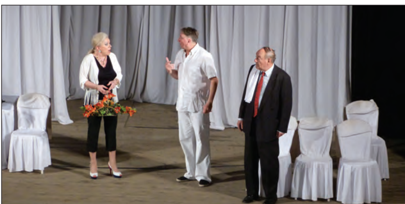
Театър „Искри и сезони,, взриви публиката с постановката „Депутатите не лъжат...?!,,