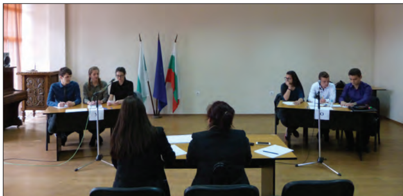
Дебат на ученици от СУ "П. Р. Славейков,, на тема: "Основоположник на събирането и съхранението на автентичния български фолклор е Дядо Славейков. Това негово дело се цени и днес,,