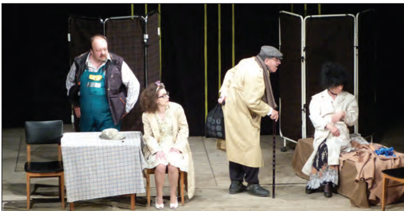
Самодейния театър при НЧ „П. Славейков 1871,, с премиера на постановката "Няма да платим,,