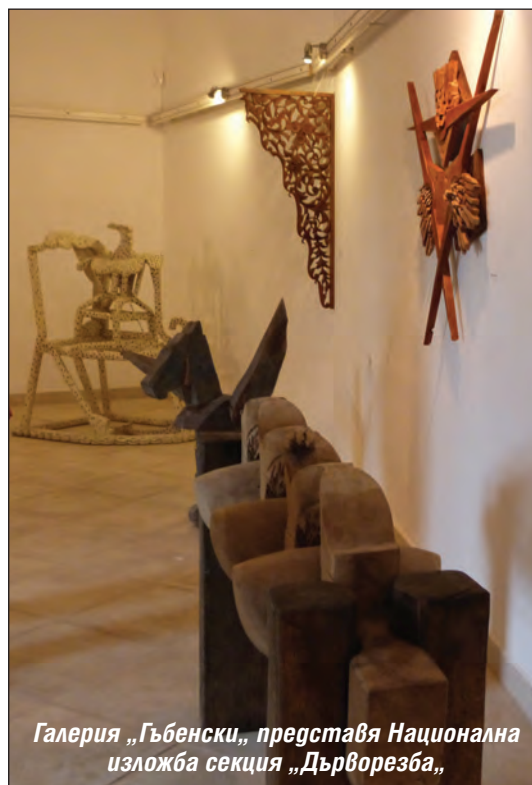
Галерия „Гъбенски“, представя Национална изложба секция „Дърворезба“