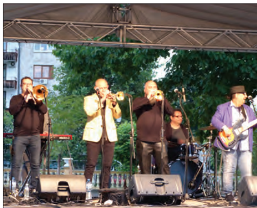
Качествена музика и добро настроение с група „Акага,,