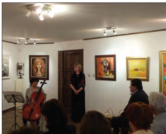
Неделно матине в Галерия „Арт-М,, на Струнно трио - Габрово