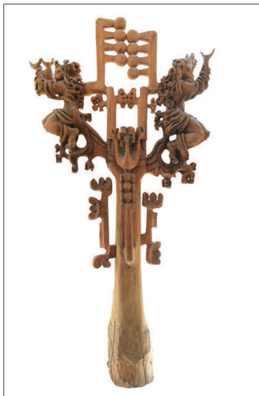
Музика, ХГ Христо Цокев Габрово 1983

и синтез с новата архитектура. В последствие по подобен начин са решени и други тавани - на посолството в Москва, в ритуалната зала в Хлебарово, таван в Бон и др.