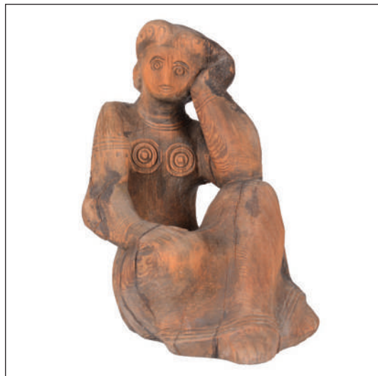
Женска фигура, ХГ Христо Цокев Габрово, 1973

Един от най-мощните обекти, изпълнен в Трявна, е таванът за „Слънчевата зала“ в резиденция Бояна. За първи път в историята на българската резба се преодоляват проблеми за овладяването на толкова голямо пространство (800 кв. м)