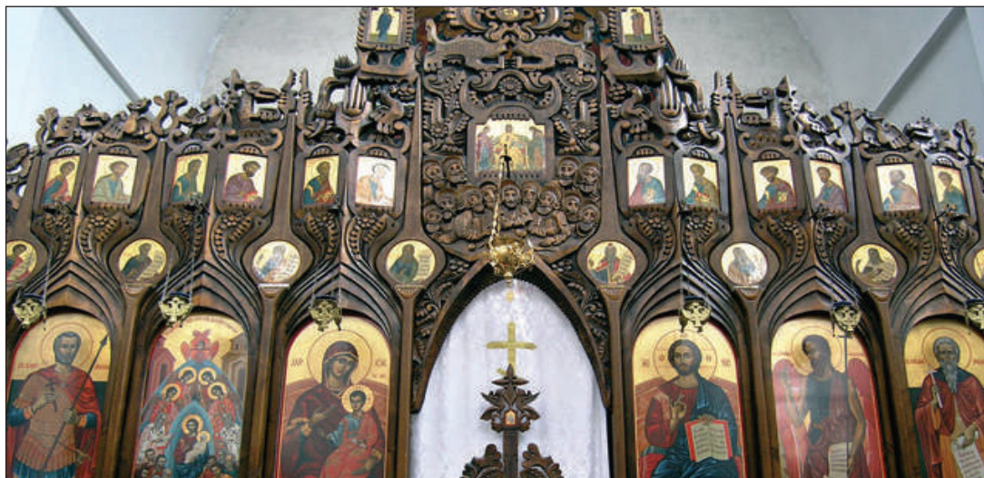
Иконостас в църквата Успение Богородично, Пампорово 1999 г.

Окръжна болница (1968), фриз за Окръжен народен съвет в Габрово (1969), скулптурното оформление на „Моста на занаятите“ в Трявна, паметник на „Незайншият строител“ на площада пред гарата